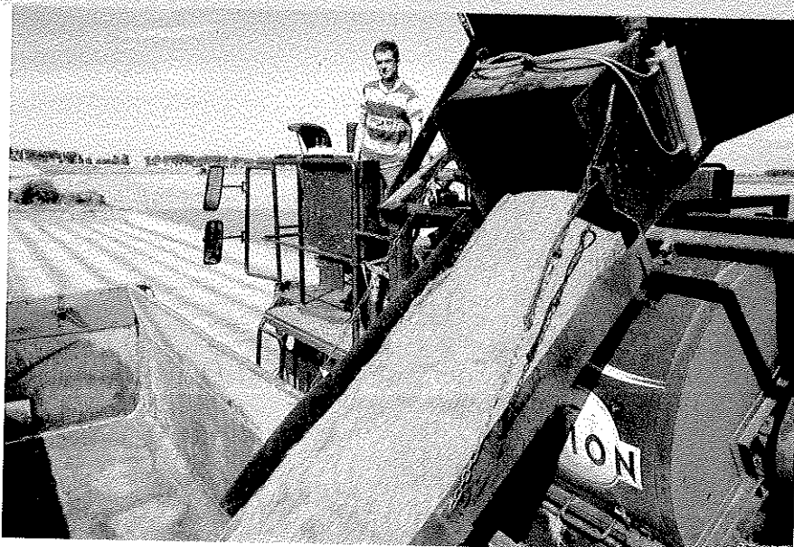
De vlasteelt in Nederland bedient twee markten: de zaaizaadmarkt en de textielmarkt (vezels). Nederlands zaa lijnzaad staat wereldwijd hoog aangeschreven.

Grootste afnemer is China. Omdat dit land de yuan koppelt aan de dollar,